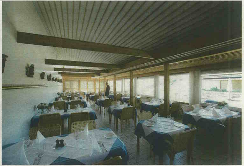
PRIVAT OG SAMMEN. I gårdhaven har beboerne mulighed for at være helt sig selv. Til gengæld er der rig lejlighed til at være sammen med de andre beboere i spisesalen.