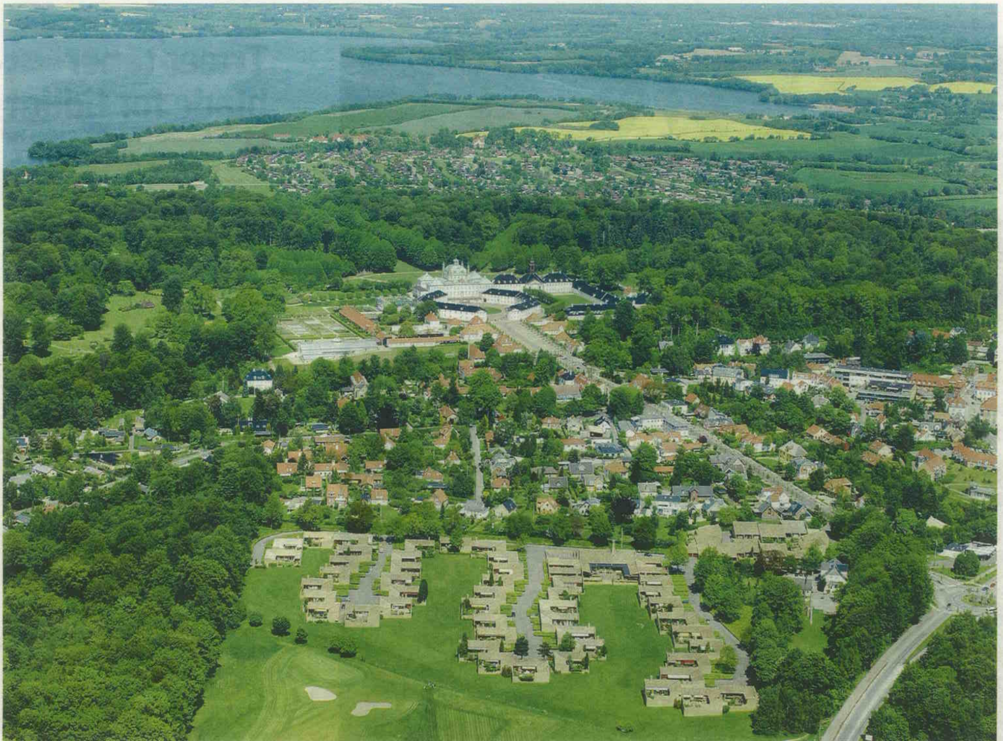
ORGANISK. Utzon anlagde Fredensborghusene som en hånd. Langs de fire 'vejfingre' ligger gårdhavehusene, mens rækkehusene er placeret i en klynge ved adgangsvejen i det nordøstlige hjørne. Fælleshuset ligger mellem de to første fingre. Fingeren langs skoven er gjort meget kort for ikke at ødelægge skovbrynet. I baggrunden ses Fredensborg Slot og Esrum Sø.