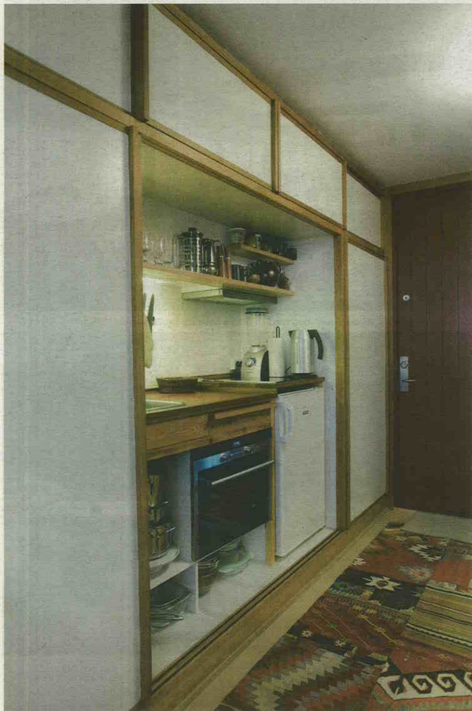
SKIBSKØKKEN. Utzon kaldte det lille køkken for 'pantryet' ligesom på et skib. Lågerne kan skydes for, så køkkenet er skjult. På bare 16 m 2 er der indrettet køkken, gang, værelse og badeværelse.